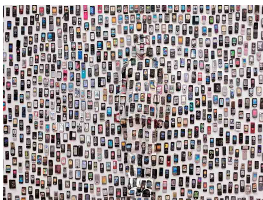
Mobile Phone, 2012, Galerie Paris-Beijing.

Liu Bolin est un artiste chinois, né en 1973. Son travail mêle à la fois la performance , la peinture et la photographie. Il se fait connaître mondialement avec sa série «Hiding in the city» («Se cacher dans la ville»). Ce travail fait suite à un traumatisme, lorsqu'en 2005, son quartier, le Suojia Village International Art Camp, est rasé en vue de l'organisation des Jeux Olympiques de Pékin. Pour exprimer sa colère, Liu Bolin se fait photographier, fondu dans les ruines de son atelier. Ses œuvres prennent une dimension sociale et politique. « Les conditions pour les artistes en Chine sont très difficiles [...], explique-t-il. Je suis là, debout, mais il y a une protestation silencieuse, la protestation contre un environnement pour survivre, une protestation contre l'État ». En se mettant ainsi en scène, l'artiste nous met en garde en nous montrant que l'on peut se laisser happer, se perdre dans une identité collective.